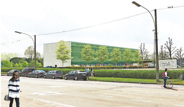
De nieuwbouw komt aan de Doorniksesteenweg te liggen, waardoor de nu wat weggestopte campus van Syntra West zichtbaarder zal worden.