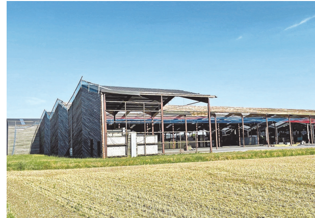
Op de grote hallen voor houtopslag liggen zonnepanelen. Door de koperdiefstal functioneert geen enkele meer in Deerlijk.